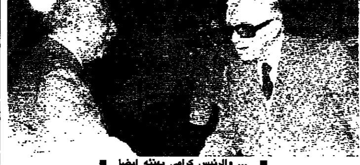
الرئيس الجميل يرحب بالرئيس شعورون ويهنئه بعيد ميلاده

وقد غادر الرئيس شعورون، الثلاثاء عشية ظهر الجلسة، وقال: انحصر البحث في القسم الأول من الجلسة بقضية الجنوب وصيدا وضرورة اتخاذ التدابير اللازمة لإعادة السلم والطمأنينة إلى صيدا وجوارها بصورة خاصة. ومن ثم بشر مجلس الوزراء بالبحث في جدول أعماله.